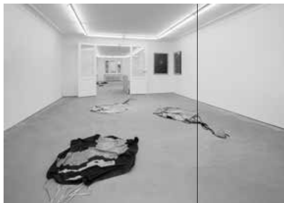
Rain of Payload Ashes (2017), handgemaakt zijde parachutes, afmetingen variabel, waterstraalgesneden aluminium cubesats sculpturen / handmade silk parachutes dimensions variable, waterjet cut aluminium cubesats sculptures, 10 x 10 x 10 cm.

According to Herregraven, the practices of the artist and the scientist are connected by the fact that they always start from an assumption, from the imagination. When a scientist comes up with the idea of a black hole – a concept that is not even visible –, they are taking a giant leap of faith. Unlike scientists, artists have a great deal of freedom when playing with assumptions because there is no need for them to substantiate their research results with proof. And that same assumption will actually help them create new artworks and even worlds. Whenever Herregraven becomes interested in a certain subject, she begins by unravelling it completely. And as soon as she has grasped the matter, she will take concepts or phenomena out of their now familiar contexts and allow them to lead new and unexpected lives. Frequently, she literally turns abstract questions into (acting) characters. They consequently end up in a space that is by definition fictional, or speculative – an exploration of reality. Herregraven aims to create a kind of ground zero, a restart after which anything can happen: an impulse to think about themes you had never contemplated at great length. However, she does alienate the created space, thus