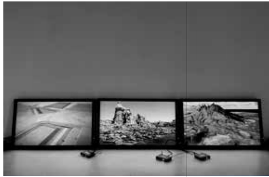
Terabytes Pushing Terrabites (2017), three channel HD video installatie, 5:26 min / three channel HD video installation, 5:26 min.