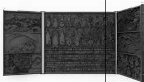
Hinged Collisions – Dormant Strain (2018), drie cnc gefreesde houten panelen, metalen server racks, metalen scharnieren / three CNC-cut wooden panels, metal server racks, metal hinges, 174 x 72 x 3,5 cm.