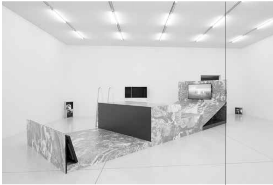
Sprawling Swamps (2016–ongoing) interactieve virtuele 3D- omgeving en 'Sprawling Swamps Docking Station' (2018) houten platform, digitale print, zwembad ladder / interactive virtual platform and 'Sprawling Swamps Docking Station' (2018) wooden platform, wallpaper, swimming pool ladder, 220 x 784 x 350 cm.