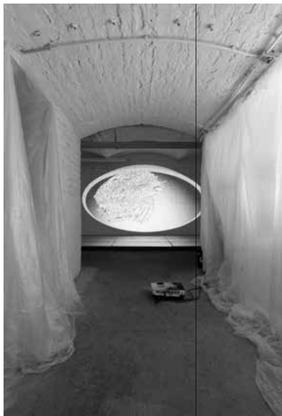
Corrupted Air – Act VI (2018–ongoing), three channel hoorspel en HD video installatie, 12:50 min, achtergelaten meubels, isolatiemateriaal, boek / three channel audio play and HD video installation, 12:50 min, abandoned furniture, insulation material, book. Installatie-detail / installation detail 'Femke Herregraven – Corrupted Air ' Future Gallery, Berlijn / Berlin.

Apart from Morgan's position as a researcher, Herregraven is also interested in the content of the aquatic ape hypothesis. It offers possible explanations for various phenomena. Supporters will for instance point out that children are attracted to water, and that while human beings have lost their fur, other apes still have theirs. Another thing that is often referred to is the diving reflex: when a mammal hits the water with its face, it will take a large breath of air and temporarily store extra oxygen in its body to keep from drowning.