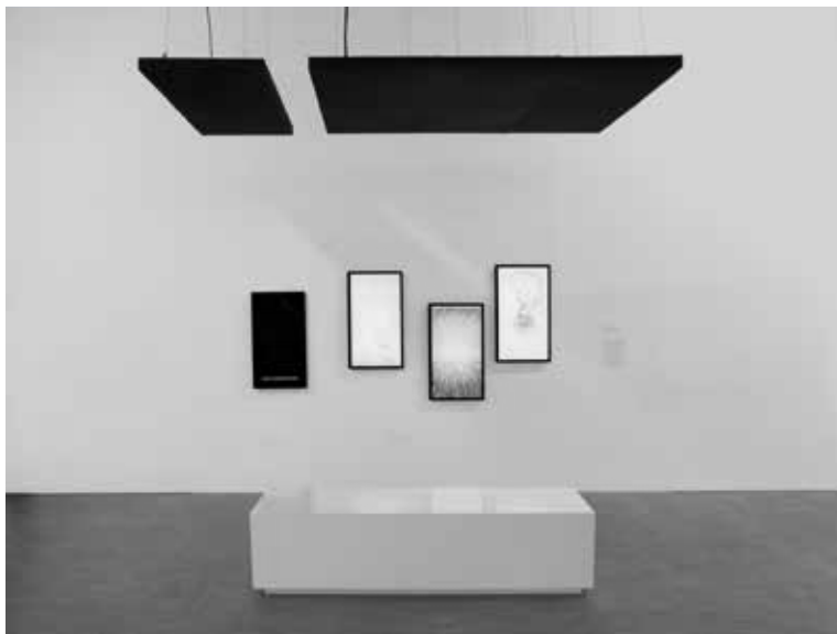
Precarious Marathon (2015), time-based generatieve audiovisuele installatie / time-based generative audiovisual installation. Installatiezicht / installation view 'Extension du domaine du jeu', Centre Georges Pompidou, Parijs / Paris.

mindfuck. But that doesn't mean that the past is missing in this world. It is present in the background and appears to be rather erratic. Herregraven explains that the concept of 'catastrophe' is derived from the Ancient Greek theatre tradition and means something like an abrupt plot twist, often clashing with its logical progress. Only in the eighteenth century, the word would be used for the first time to describe a natural disaster. In science, some hypotheses and theories are not that easily accepted, Herregraven relates, because they are so very different from the accepted story – that, incidentally, may not be that well-founded either. The mechanism of not accepting is not always a case of plausibility, but frequently also of discomfort because it upsets an entire world image. In that case it would not so much be the past itself that changes, but its representation – not the event, but its re-narration or recollection. Final proof of the aquatic ape would cause such an extensive rewrite. My imagination is immediately set to work. I am visualizing an inverse catastrophe, a kind of whirlwind. After it stops raging, all history books turn out to be altered – and with that, the future. The Last Man's calendar is changing right in front of his eyes.